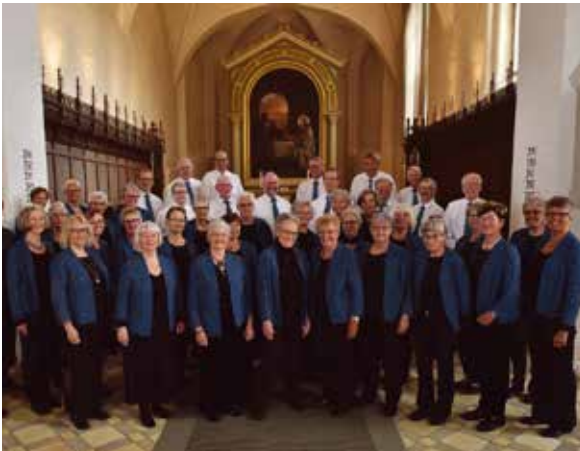
Faaborg A' Capellakor

Musikskolens traditionsrige og årlige advents- og julekoncert. En lang række af musikskolens dygtige elever viser deres kunnen i Faaborg Kirke. Et broget og et fascinerende indblik i musikskolens kreative arbejde, og måske et glimt af fremtidens musikalske stjerner.