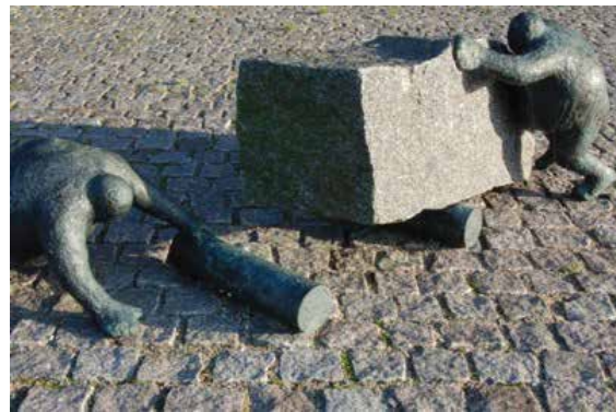
To mænd med granitblok 2002, bronze og granit, Kalundborg Rådhus

at der er plads til det hele; humor og alvor, latter og gråd. Den tykke mands optimisme og ukuelighed er nødvendigt, for ellers gik det aldrig.