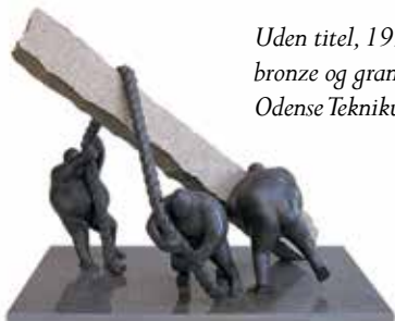
Uden titel, 1995, bronze og granit, Odense Teknikum

For der er noget forunderligt og håbefuldt over de små tykke mænd og kvinder. Ja, man bliver ligefrem i godt humør af at se de små modige mænd give sig i kast med livets opgaver. Så enkelt og så vanskeligt. Og livet og tilværelsen er – det ved vi alle – en blanding af lethed og tyngde. Af alvor og sjov. Det er aldrig til at sige hvornår det ene slutter og det andet tager over. Bedst når vi griner allermest, kan der som lyn fra en skyfri himmel komme en mørk alvor over livet. Bedst som vi tror os sikre, ramler det hele. Skilsmisse, arbejdsløshed, sygdom, død. . . . . Og vi må møjsommeligt starte helt forfra igen. Hvis vi altså kan.