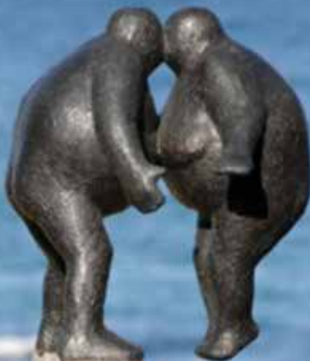
'Kysset' Keld Moseholm 2009, bronze og granit.

81. ÅRGANG. - NR. 3 - JUNI – JULI – AUGUST 2016