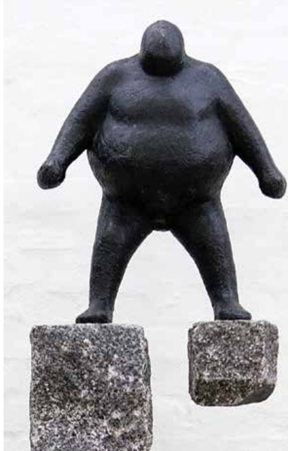
Utopia, 2006, bronze og granit